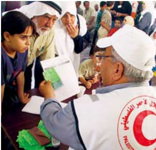
巴勒斯坦红新月会的志愿者向贫困家庭分发由红十字国际委员会提供的兑换券，他们凭券能够交换食物或其它必需品。

这些合作活动在与国际联合会进行密切磋商和协调下开展的；国际联合会在协助国家红会总体发展工作方面发挥着主导作用。