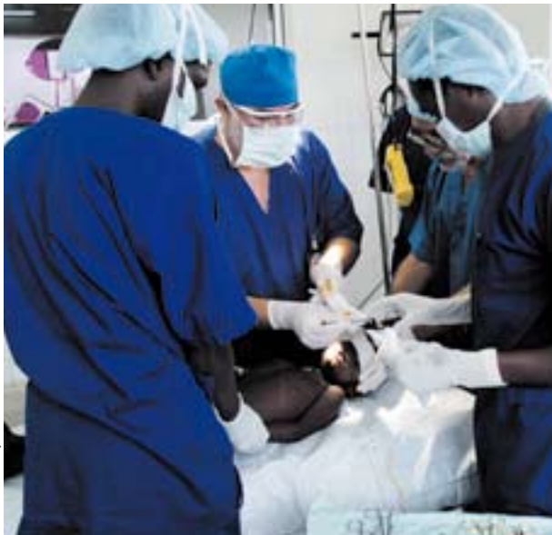
苏丹，达尔富尔。为因冲突而受伤的人实施外科手术需要专门的培训。

处理监狱在押人员的健康问题还要有做出正确医疗评估所必需的培训和知识，以确认被拘留者是否受过酷刑或其它形式的残酷、以及不人道且有辱人格的待遇。