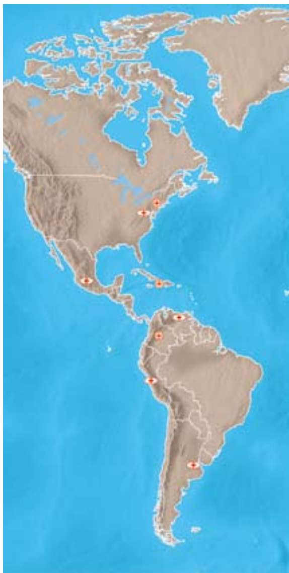
本地图仅供参考，不具任何政治意义。

各代表处还构成了一个重要的预警体系。这样，红十字国际委员会就能够在武装暴力或冲突爆发时迅速有效地应对各种需求。