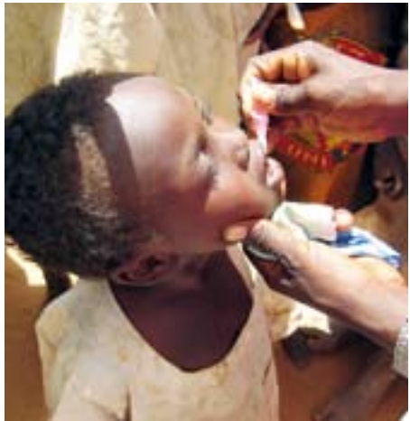
Leigh Daynes/British Red Cross

在苏丹的达尔富尔，儿童在流离失所者营地中接种小儿麻痹症疫苗。在冲突期间，定期免疫项目中断，使居民容易罹患传染性疾病。