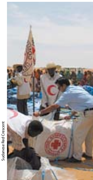
Sudanese Red Crescent

根据《日内瓦公约》的规定,带有红十字、红新月或红水晶标志的人员、车辆和建筑物必须得到尊重和保护。